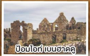
ป้อมโอ๊ก เบนฮาดดู