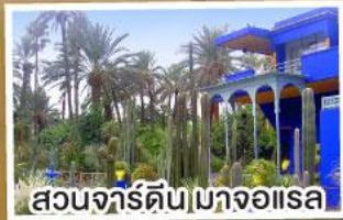
สวนจาร์ดินมาจอสรา

เดินทาง 14-23 มี.ค. 68 23 เม.ย.-02 พ.ค. 68 02-11 พ.ค. 68