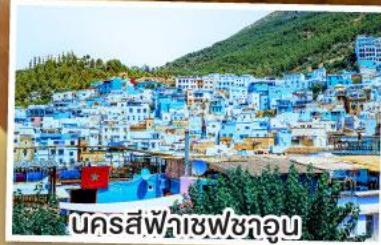
นครสีฟ้าชفشวอน