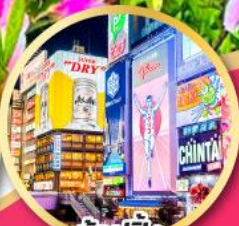
ช้อปปิ้ง ชินโซบาชิ