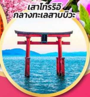
เสาโทริอิ กลางทะเลสาบบิวะ