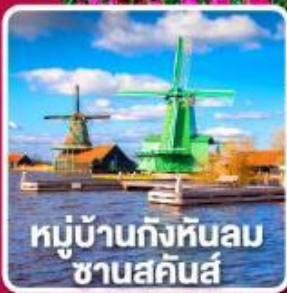
หมู่บ้านกังหันลม ซานสคินส์