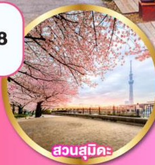
สวนสุมิคะ

หลวงพ่อดำ" แห่งวัดโคโตคุจิน ชมซากุระ: ริมทะเลสาบคาวากุจิโกะ ชมซากุระ: ณ สวนสุมิคะ พร้อมวิวโตเกียวสกายทรี บุฟเฟ่ต์ ฆาปุกยักษ์ อีสรະ: ท่องเที่ยว 1 วันเต็มในโตเกียว