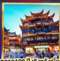
ตลาด 100 ปี เติ้งหวิงเมี่ยว