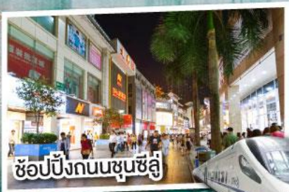
ช้อปปิ้งถนนชุนชี่