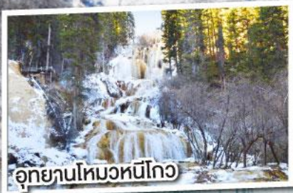
อุทยานโหมวหนี่โกว