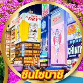
ชินโซบาช