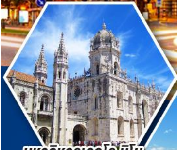
มหาวิหารเจโรนิโม