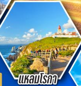
แหลมโรกา