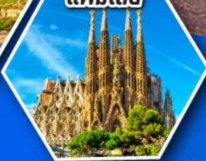
โบสถ์ซากราดา แฟมิเลีย