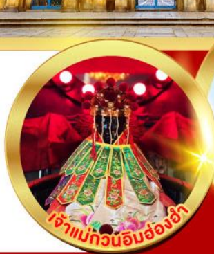
เจ้าแม่ทวนอิมฮ่องฮ่า