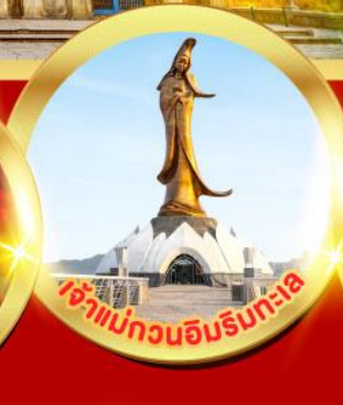
เจ้าแม่ทวนอิมริมทะเล