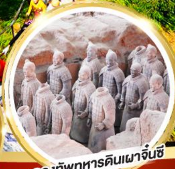
กองทัพทหารดินเผาจีนซี