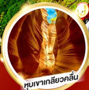
หุบเขาเกลียวคลื่น