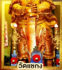
วัดไถ่แซง