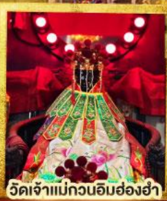
วัดเจ้าแม่กวนอิมฮ่องฮ่า