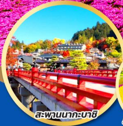
สะพานนากะบาชิ