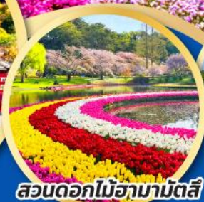
สวนดอกไม้ฮามามัตสึ