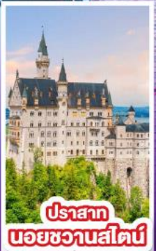
ปราสาท นอยชวานสไตน์