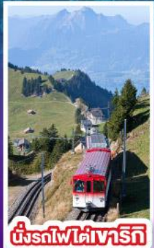
นั่งรถไฟใต้เขารัทช์

ประกันสุขภาพและอุบัติเหตุ 3,000,000 คุ้มครองสูงสุด *จำนวนผู้ร่วมทริปสามารถขอรับประกันได้