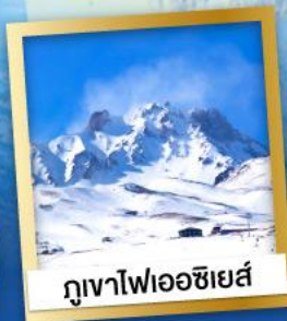
ภูเขาไฟเอซียส์