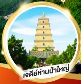
เจดีย์ห่านป่าใหญ่