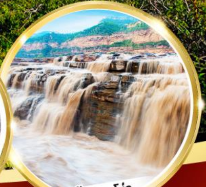
น้ำตกหูโจว