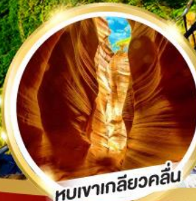
หุบเขาเกลียวคลื่น