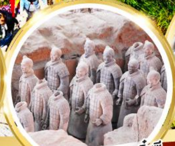
กองทัพทหารดินเผาจีนซี