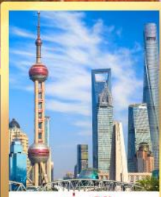
เซี่ยงไฮ้