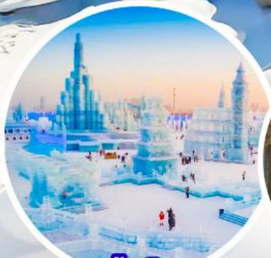
เทศกาลน้ำแข็งฮาร์บิน