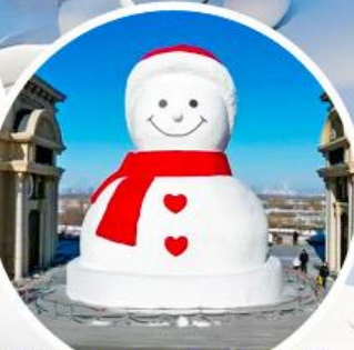
ตุ๊กตามนุษย์หิมะยักษ์