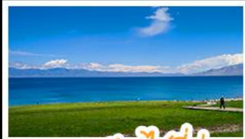
ทะเลสาบไซลุ่มู่

หุบเขาดอกท้อ - ทะเลสาบไซลุ่มู่ แกรนด์แคนยอนตู่ชานจื่อ - ทุ่งหญ้านาดาลี