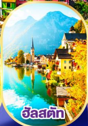
ซาลซ์บวร์ก