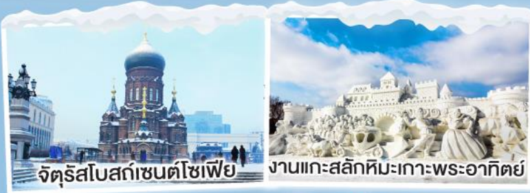
จัตุรัสโบสถ์เซนต์โซเฟีย