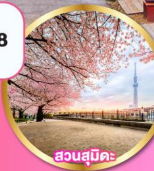
สวนสุมิคะ

หลวงพ่อดำ" แห่งวัดโคโตคุจิน ชมซากุระ: ริมทะเลสาบคาวากุจิโกะ ชมซากุระ: ณ สวนสุมิคะ พร้อมวิวโตเกียวสกายทรี บุฟเฟ่ต์ ฆาปุกยักษ์ อีสาระท่องเที่ยว 1 วันเต็มในโตเกียว