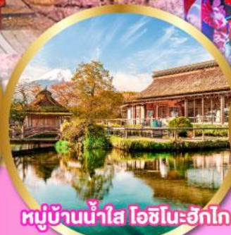
หมู่บ้านน้ำใส โอชิโนะฮักไก