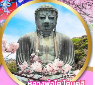
หลวงพ่อดำโคโตคุสิ