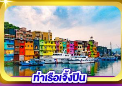
ท่าเรือเจิ้งปิน