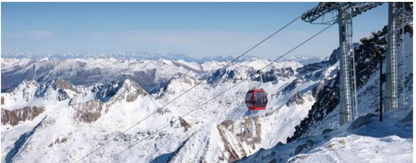
GO1TFU-TG108 เิงตุ สี่ดรุณี ปี่เผิงโกว ต้ากู่ปิงชว่น จิวจ้ายโกว 7วัน 6คืน (นั่งรถไฟความเร็วสูง) * ไม่ลงร้านช้อปปิ้ง โดยสายการบิน Thai Airways (TG)

จากนั้นนำท่านเดินทางสู่ อุทยานสวรรค์ภูเขาหิมะกลาเซียร์“ต้ากู่ปิงชว่น” (ใช้เวลาเดินทางประมาณ 3 ชั่วโมง) ถือได้ว่าเป็นอุทยานสมบัติทางธรรมชาติที่ล้ำค่าของมณฑลเสฉวน ที่มีความงามไม่แพ้อุทยานและทะเลสาบไตโถบนโลกมนุษย์ จุดที่สูงที่สุดมีความสูงจากระดับน้ำทะเลประมาณ 5,286 เมตรเป็นภูเขาน้ำแข็งที่ศักดิ์สิทธิ์ ชาวบ้านเชื่อว่ามีเทพเจ้าพิทักษ์ภูเขาแห่งนี้อยู่ ทำให้ภูเขาแห่งนี้ยังมีใครพิชิตยอดเขาได้