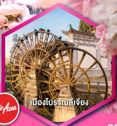
เมืองโบราณลีเจียง