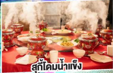
สุกี้ไคมน้ำแข็ง