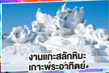
งานแกะสลักหิมะ เกาะพระอาทิตย์