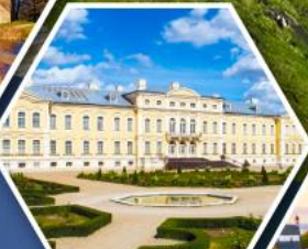
พระราชวังรินคาล