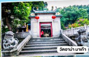
วัดอาน่า มาเก๊า