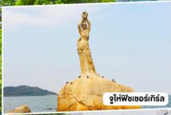
จูไห่ฟิชเชอร์เกิร์ล