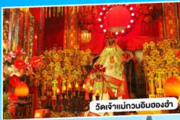
วัดเจ้าแม่กวนอิมของฮ่า

*นั่งรถข้ามสะพานเซินเจิ้น-จงซาน "สะพานข้ามทะเลที่สูงที่สุดในโลก"