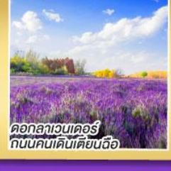
ดอกลาเวนเดอร์ กับคนเดินเตี้ยขี้อื่อ