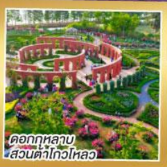
ดอกกุหลาบ สวนต้าโก้วไหลว