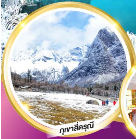
ภูเขาสีดรุณี