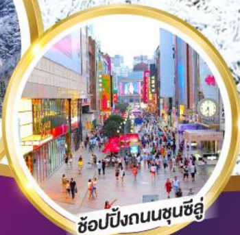
ช้อปปิ้งถนนชุนชิว