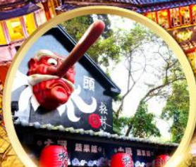
หมู่บ้านปัสจาง