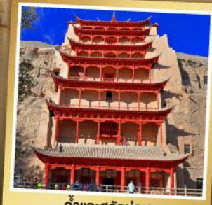
ต้าแกะสลักม่อเกา