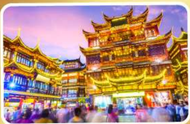
ตลาดร้อยปีเจิ้งหวังเมี่ยว