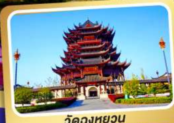
วัดทองหยวน