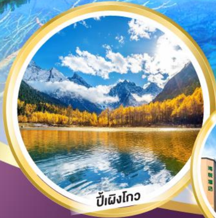
ปีเหมิงโกว