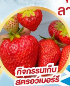
กิจกรรมเก็บ สตรอว์เบอร์รี่