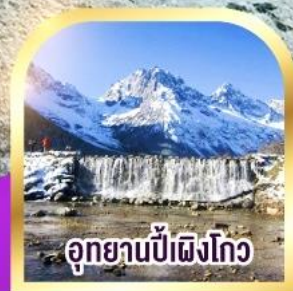
อุทยานปี่ผิงโก