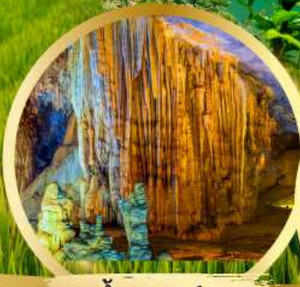
ถ้ำสวรรค์