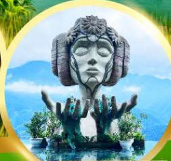
โมนาน่า ซาปา คาเฟ่