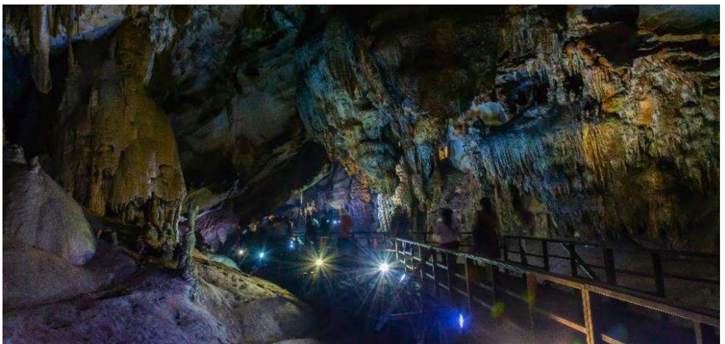
GO1HAN-VJ101 GO VIETNAM เวียดนามเหนือ ฮานอย ซาปา ฟานซิง ฮาลอง 5 วัน 4 คืน โดยสารการบิน Vietjet Air (VJ)

ระหว่างท่องเที่ยวชม ถ้ำสวรรค์ หรือ “ถ้ำนางฟ้า” ชมหินงอกหินย้อยแห่งอ่าวฮาลองที่มีอายุนับล้านปี มีโครงสร้างสลับซับซ้อนกันหลายชั้นพร้อมประดับไฟไว้อย่างสวยงาม ภายในถ้ำจะเห็นได้ว่าหินงอกหินย้อยต่าง ๆ นั้นจะมีลักษณะรูปร่างแตกต่างกันออกไป ตามแต่ท่านจะจินตนาการ ขึ้นอยู่ว่าแต่ละท่านจะตีความออกมาว่าเป็นรูปร่างเหมือนสิ่งใดในถ้ำเราจะเห็นหินรูปร่างฟ้าที่ถูกสร้างขึ้นมาจากทางธรรมชาติที่ติดอยู่ภายในผนังถ้ำ นับว่าเป็นสิ่งมหัศจรรย์อย่างหนึ่งและมีตำนานเล่าขานกันว่า มีเหล่านางฟ้าเข้ามาอาบน้ำในถ้ำแห่งนี้และเกิดหลงไหลชายหนุ่มผู้ที่เป็นมนุษย์เลยคิดที่จะไม่ยอมกลับไปสวรรค์ จนกระทั่งเวลาผ่านไปกลุ่มนางฟ้าทั้งหลายเลยกลายเป็นหินติดอยู่ที่ผนังถ้ำอย่างน่าอัศจรรย์.