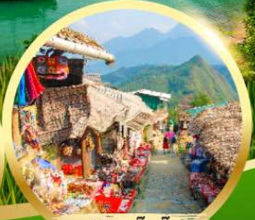
หมู่บ้านก๊ตก๊ต