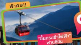
ราคาเริ่มต้น