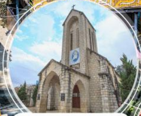
โบสถ์ซาปา