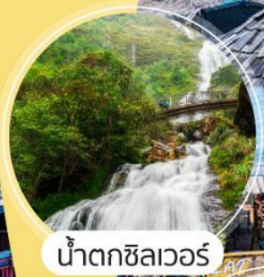
น้ำตกซิลเวอร์