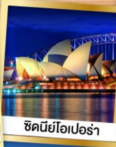
ซิดนีย์โอเปร่า