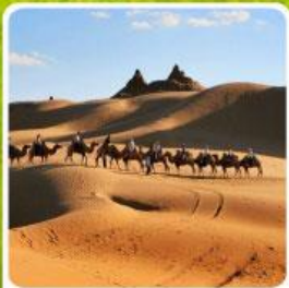
เป็นทราเยเสียงชวาน