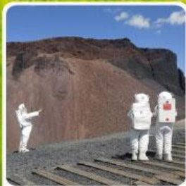
ภูเขาไฟอูลันฮาตา