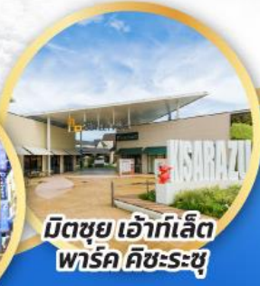
มิตซึย เอ้าท์เล็ต พาร์ค คิชะระชู