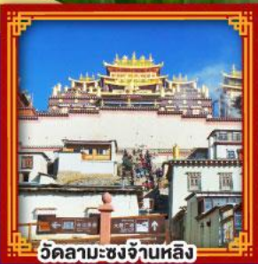
วัดลามะซงจันหลิง