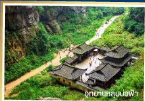
อุทยานหลุมง้อฟ้า