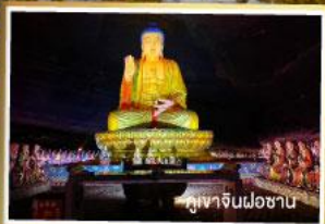
บู๊ตงจินฝอซาน