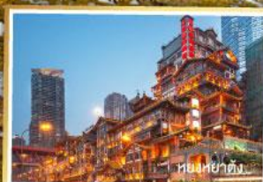
หอนงเหย่าต้ง