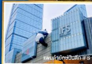
เพนค้ายักษ์ปิ่นตึก IFS