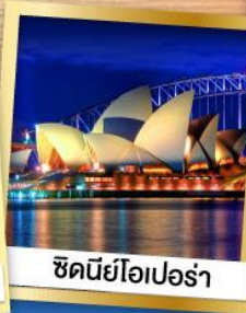
ซิดนีย์โอเปอเร้า