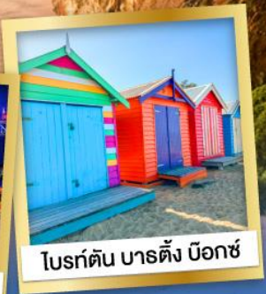
ไบรด์ตัน บาร์ตัง นีอกซ์