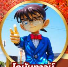
โคนินทาวน์