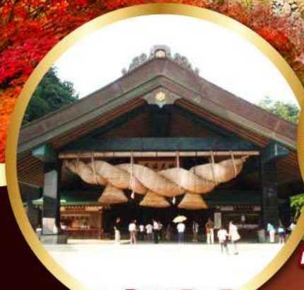
ศาลเจ้าอิชิโมะโทชะ