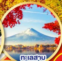
ทะเลสาบ คาวาคูจิโกะ