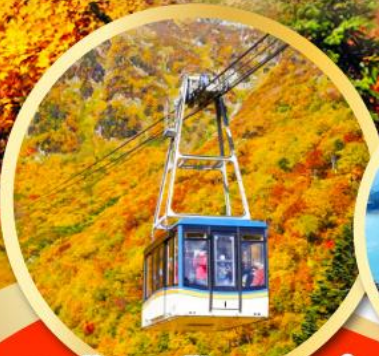
กระเช้าลอยฟ้าทากายาม่า