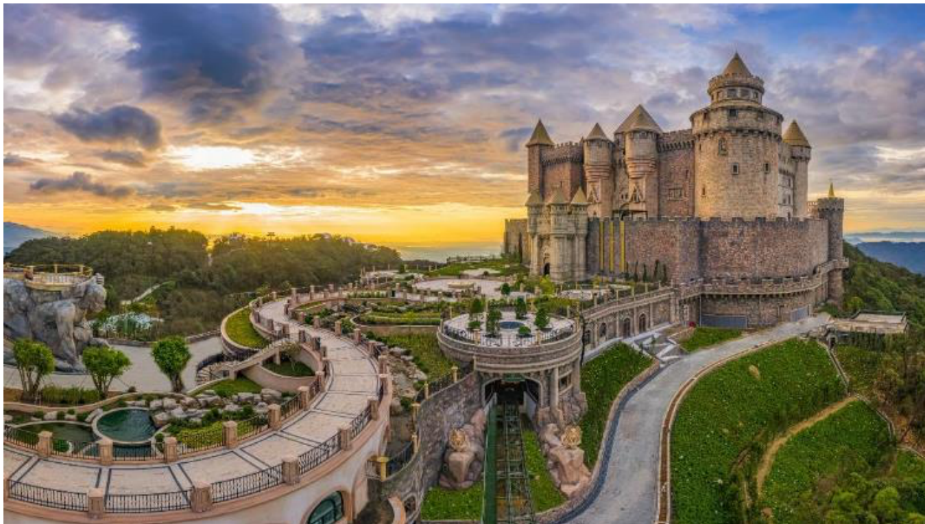
กลางวัน รับประทานอาหารกลางวัน ณ ภัตตาคาร (มื้อที่ 2) * เมนูพิเศษ บุฟเฟต์นานาชาติ บนบานาฮิลล์