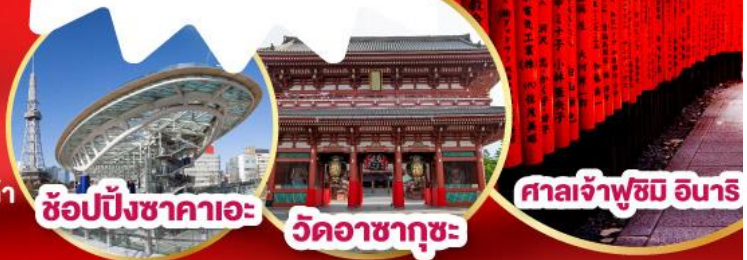
ช้อปปิ้งซากาเอะ