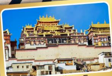
วัดลามะชงจ้านหลิง