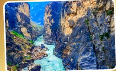
ช่องแคบสี่กระโจน

เมนูพิเศษ!! สุกี้ปลาแซลมอน สุกี้เห็ด อาหารกวางตุ้ง