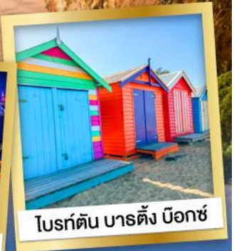
โบรด์ตัน บาร์ตัง ม็อกซ์