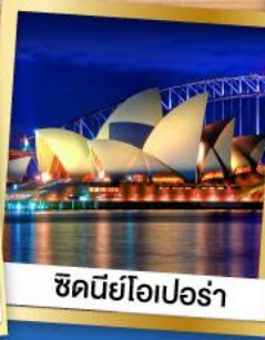
ซิดนีย์โอเปร่า