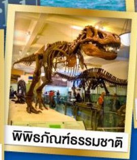
พิพิธภัณฑ์ธรรมชาติ