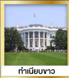
ทำเนียบขาว